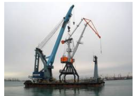
Ein klassischer Hafenportalkran der Fa. Ardelet.